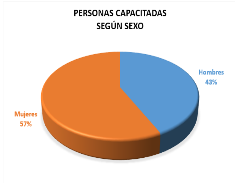
De 42 capacitados en el mes de diciembre 2022